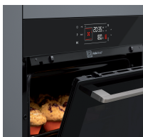
Hot Air Shield